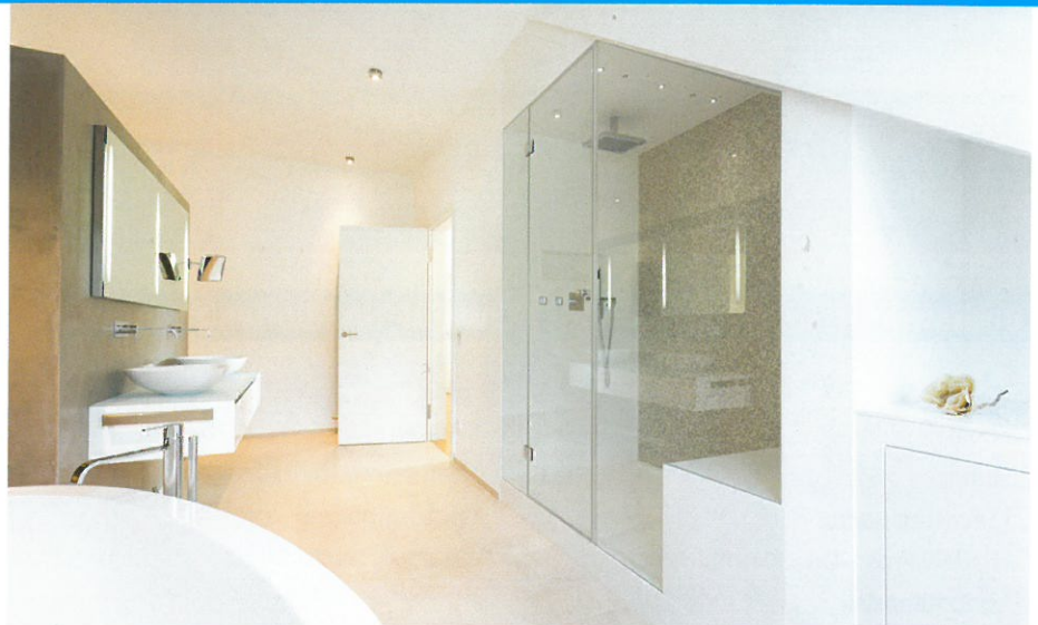
Foto: Rebecca Hammer, Badplanung Realisierung / Bukoll GmbH Bäder & Wärme / Dampfdusche baYou GmbH